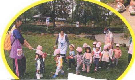
1歳児は誘導ロープで移動します (岡之郷緑地公園)