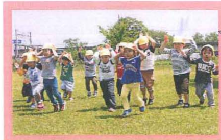
3歳児のウサギ 変身競争

「春の遠足」は全園児お弁当を持っての園外保育です。今年も神流川ピクニック広場へ行ってきました。広い芝生広場ではクラスごとに動物に変身してのかけっこや、「おやつ」を探す宝探しをして楽しみました。思い切り走った後は、待ちに待ったお弁当。芝生広場には大きい木が2本あり、涼しい木かげで手作りのお弁当を美味しく食べることができました。