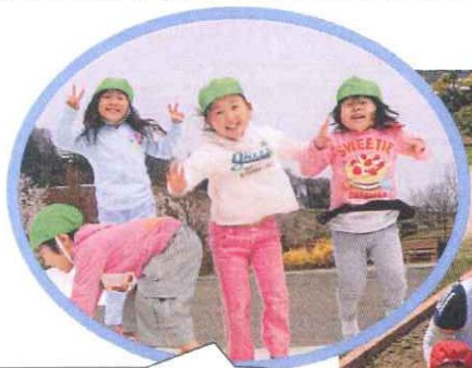
ファミリーパークは ふわふわドームが人気