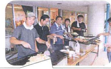
お父さんが作るバーベキューは格別

お父さんの会「パパっ子クラブ」の親子バーベキューが今年も盛大に開催されました。参加者は親子合わせて58名。ソース入れすぎの「特製黒焼きそば?」が出来たりのハプニングもありましたが、お父さんの作る美味しいバーベキューをお腹いっぱい食べることができました。特に今年は保育士ユニット「TAKK・F」(タックエフ)も登場。抜群のハーモニーに食べるのも忘れ聞き入っている子どもたちもいて、場を盛り上げていました。