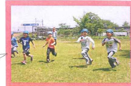
宝さがしの「宝」は走って探します (年長児)