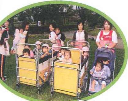
0歳児は散歩車やおんぶで移動です