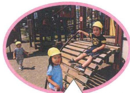
玉村町北部公園は楽しい遊具がいっぱい