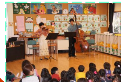
群響 若林ご夫妻の バイオリンと コントラバスとのデュオ

群馬交響楽団の若林ご夫妻によるバイオリンとコントラバスの演奏会が開催されました。クラシックに始まり、ディズニーの曲やアニメの曲、そして今年の運動会で演奏した鼓隊の「狙い撃ち」と「ありがとう」の曲も登場し、皆大喜びでした。1時間の演奏会でしたが、身近に聞く弦楽器のすばらしい音楽に全員集中して聞くことができました。