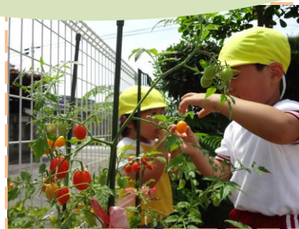
ミニトマトの収穫 (年少児 きいろ組)