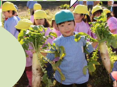
大根抜き(年長児 みどり組)