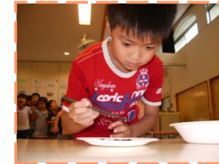
豆の移し替えゲームでは 真剣な表情(年長児 みどり組)

「箸を正しく使ってご飯をおいしく食べよう」を目標にお箸の持ち方指導をしています。時には豆の移し替えゲームで意欲を高めています。