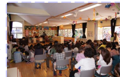
子育て支援センター わたぼうしの親子も 一緒のコンサート