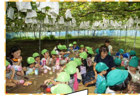
ぶどう棚の下で食べるぶどうはおいしいね (年中児 きみどり組 年長児 みどり組)