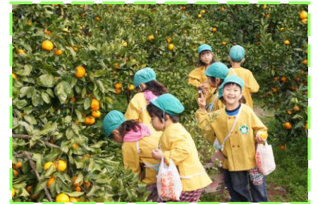
寄居町風布みかん山での みかん狩り(年長児 みどり組)