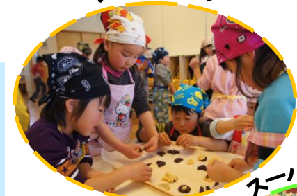
(年中児 きみどり組)

年長児を中心にクッキング保育を行っています。7月には保育園の畑で収穫したジャガイモの皮をむいたり、切ったりして「ゆでじゃが」を作りました。11月はホットケーキ、2月にはスーパーで食材の買い物をして好み焼きも作っています。年中児はクッキー作りに挑戦。クッキーをこねて型を取り焼きます。その他に人参やとうもろこしの皮むき、グリーンピースのさや出し、ピーマンの種取り等、給食の食材に親しむ機会を増やしています。