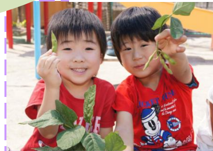
園庭の枝豆を収穫して皆で食べました (年長児 みどり組)