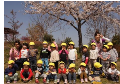
園外保育 北部公園の桜の下で

桜の花咲く公園への園外保育、ミカンの木に囲まれてのみかん狩り、甘い香りの中でイチゴ狩り。きいろ組は1年の中でたくさんの思い出ができました。