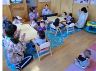
お部屋で ♪むすんでひらいて♪を 歌いましょう