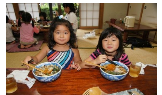
お泊り会 昼食 温かい麺