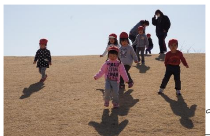
小高い丘を駆け降りてみました