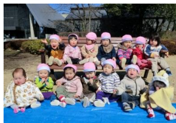
お別れ遠足 群馬の森 全員集合でした！

今年度ももも0は、14名ととても多く、にぎやかなクラスになりました。入園当初は、ちいさかった子供たちも今では、いろいろなことができるようになりました。