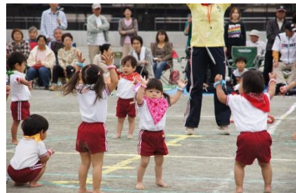
運動会でちびっ子カーボイのダンス