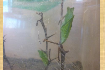
羽化を待つさなぎ