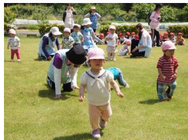
春の遠足でかけっこ競争

4月当初はまだまだ赤ちゃんだったもも1さんも今ではすっかりお兄さんお姉さんらしくなり、おはなしもたくさんできるようになりました。