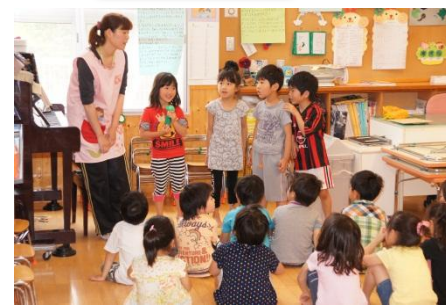
毎朝のご飯の発表

みどりぐみは、自分の意志や意見が言えるようにと毎朝、朝食、前日の夕食の発表を行ってきました。夏のお泊り会では、子供たちに昼食を選んでもらい、お店で昼食を食べました。