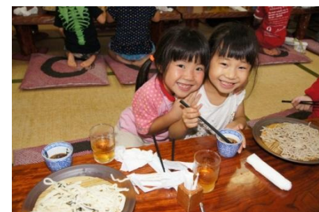
お泊り会 昼食 冷たい麺