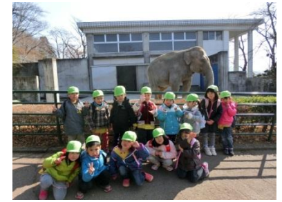
桐生が岡動物園で象と