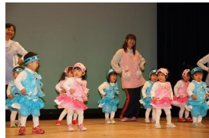
クリスマス会でおしりフリフリダンス