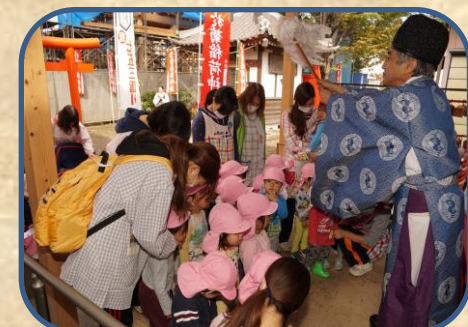
お祓いしてもらいました