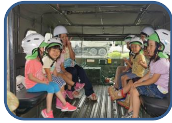
高機動車は乗り心地抜群！

毎年6月に陸上自衛隊新町駐屯地を訪問しています。駐屯地では高機動車（和製ハマーとも言われている国産の自衛隊専用車）の幌の荷台に乗り駐屯地内一周や、資料館の見学。また、自衛隊ラッパの演奏を聴いたりラッパを吹いてみたりと普段では出来ないことを体験しています。