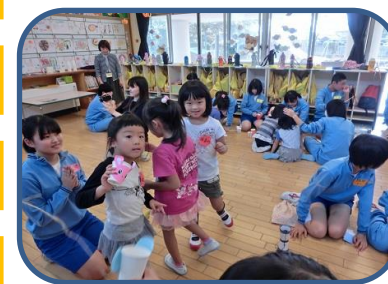
手作りおもちゃで遊んだよ

毎年秋に新町中学校の3年生が家庭科の授業の一環として、クラスごとに3日間来園します。中学生が作った手づくりおもちゃで楽しんだり一緒にゲームをしたりして交流しています。