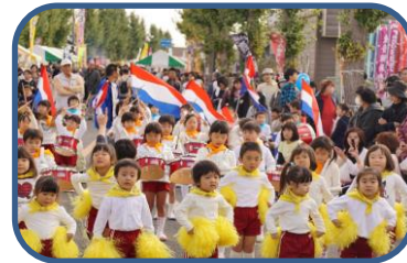
商工祭での鼓隊演奏

新町のお祭りにも参加しています。毎年11月の第1日曜日に開催される商工祭では年長、年中、年少児が鼓隊演奏で参加しています。商工祭は賑やかなお祭りでも、道路での演奏では演奏する園児のすぐ隣まで見学者がいます。11月中旬のふれあいコンサートでは中河原保育園、新町第二保育園の年長児と合同で歌を発表しています。また、3月実施の新町ひなまつりでは年長児が歌とメロディオンで参加しています。