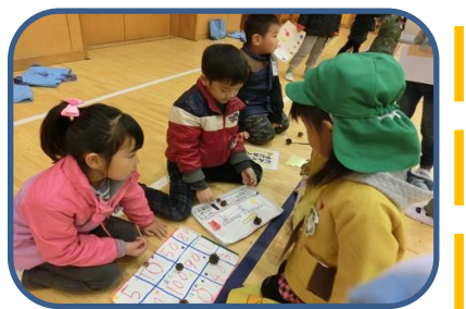
ゲームをするとシールをもらえます

また、新町第一小学校では毎年「生活科：あきとあそぼう」と題して新町保育園と上武大学附属幼稚園の年長組を招待し、体育館で秋の素材を使ったおもちゃ等のお店を開いての交流を行っています。