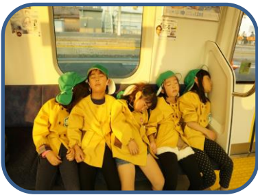
帰りはお昼寝です