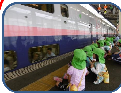
カッコいい車体にびっくり

新町には高崎線新町駅があり、特急電車も停まるため毎日多くの方が通勤、通学に利用しています。また、新町は新幹線の高架線路も近く、走っている新幹線も見ることが多くあります。電車という社会資源体験のため、年中児は高崎駅の新幹線ホームで新幹線見学。年長児は新町駅から特急電車に乗って上野動物園に遠足に行っています。6月の年中児の新幹線ホームの見学では駅員さんからの話を聞きますが、北陸新幹線「かがやき」がものすごいスピードで通過すると子どもたちの目が釘付けになります。また、11月実施の上野動物園遠足では行きは特急電車の指定席、帰りは各駅停車と電車を変えて体験しています。家庭ではほとんど車なので、電車に初めて乗る園児も毎年何人かいます。