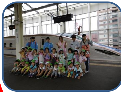
北陸新幹線「はくたか」です

新町には高崎線新町駅があり、特急電車も停まるため毎日多くの方が通勤、通学に利用しています。また、新町は新幹線の高架線路も近く、走っている新幹線も見ることが多くあります。電車という社会資源体験のため、年中児は高崎駅の新幹線ホームで新幹線見学。年長児は新町駅から特急電車に乗って上野動物園に遠足に行っています。6月の年中児の新幹線ホームの見学では駅員さんからの話を聞きますが、北陸新幹線「かがやき」がものすごいスピードで通過すると子どもたちの目が釘付けになります。また、11月実施の上野動物園遠足では行きは特急電車の指定席、帰りは各駅停車と電車を変えて体験しています。家庭ではほとんど車なので、電車に初めて乗る園児も毎年何人かいます。