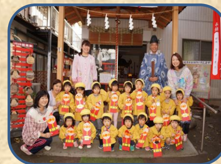
神主さんと“はいポーズ”

今年は於菊稲荷神社の本殿が建築中のため、仮神殿でのお参りでした。神主さんがクラスごとにお祓いをして「子どもたちが元気に大きくなれますように」と拝んで下さいました。