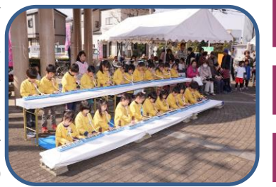
新町ひなまつりはメロディオン演奏です

新町のお祭りにも参加しています。毎年11月の第1日曜日に開催される商工祭では年長、年中、年少児が鼓隊演奏で参加しています。商工祭は賑やかなお祭りでも、道路での演奏では演奏する園児のすぐ隣まで見学者がいます。11月中旬のふれあいコンサートでは中河原保育園、新町第二保育園の年長児と合同で歌を発表しています。また、3月実施の新町ひなまつりでは年長児が歌とメロディオンで参加しています。