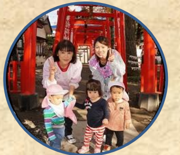
元気に大きくなれますように