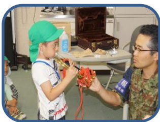
ラッパを吹かせてもらいました

毎年6月に陸上自衛隊新町駐屯地を訪問しています。駐屯地では高機動車（和製ハマーとも言われている国産の自衛隊専用車）の幌の荷台に乗り駐屯地内一周や、資料館の見学。また、自衛隊ラッパの演奏を聴いたりラッパを吹いてみたりと普段では出来ないことを体験しています。