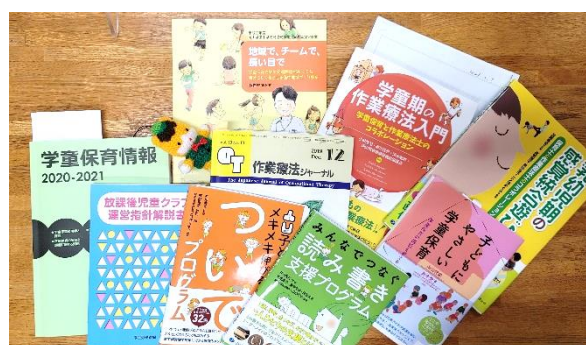
続々と作業療法士に関する書籍が出版される