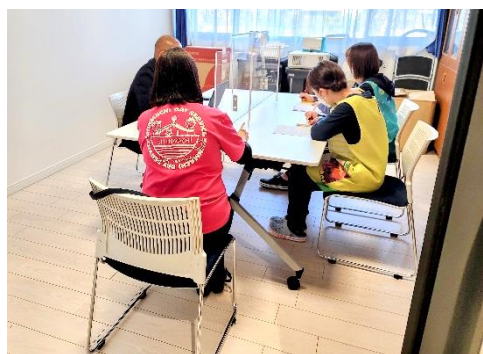
年長児の担任とコンサル