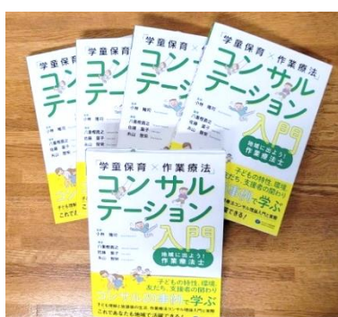
学童のコンサル事例掲載