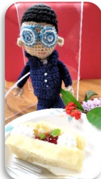
おからを利用したケーキ