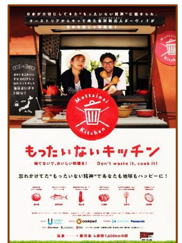
映画「もったいないキッチン」