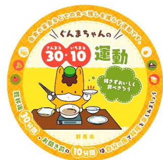
残さず食べよう！ 初めの30分、最後の10分