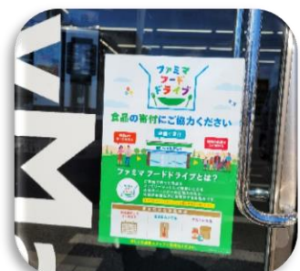
ファミマフードドライブ